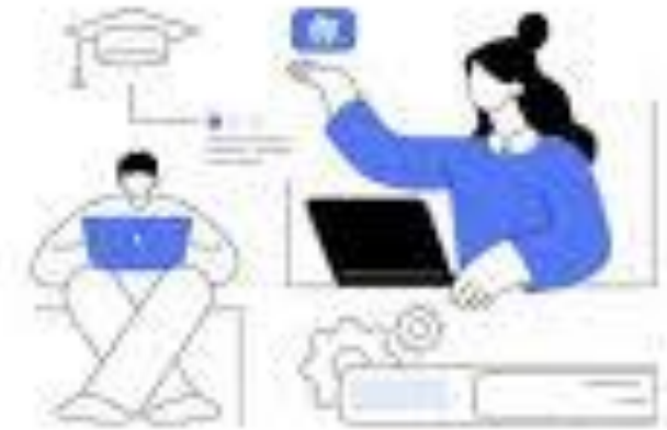
ONLINE LANGUAGE SCHOOL