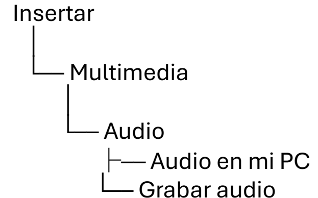
DIAGRAMA SIMPLE DE AUDIO