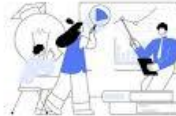
PROFESSIONAL DEVELOPMENT OF TEACHERS