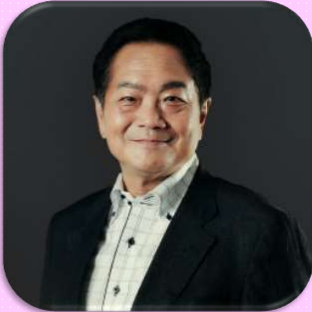
Ken Kutaragi. 1950.