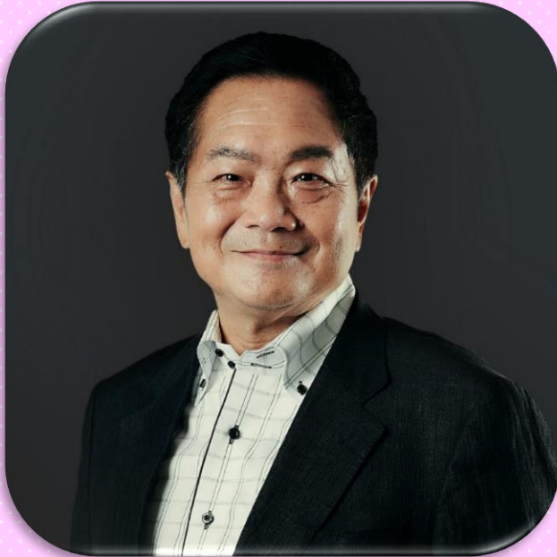
Ken Kutaragi. 1950.