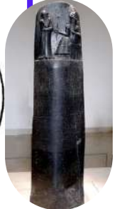
Código de los Hititas Código de Hammurabi