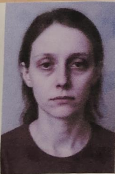
Facie de Leonina