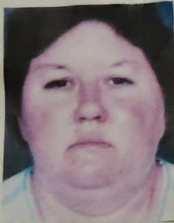
Facies síndrome de Cushing