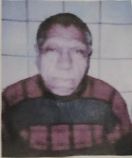
Facie de la acromegalia.