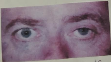
Facies del síndrome de Horner.