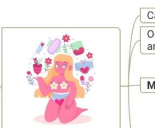
Etapas de la Pubertad

Cambios físicos iniciales Ocurre durante los 2 años anteriores a la pubertad