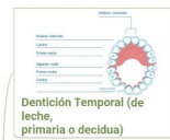
Dentición Temporal (de leche, primaria o decidua)

Número total: 20 piezas Erupción: Comienza entre los 6-8 meses con los incisivos centrales inferiores. Compleción: Antes de los 2 años y medio. Caída: Inicia alrededor de los 6 años Retraso: Se considera tras la ausencia de dientes a los 15 meses.