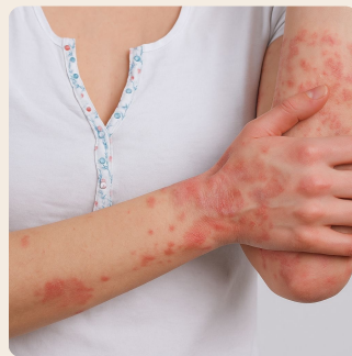
Respuesta no deseada, perjudicial, grave.