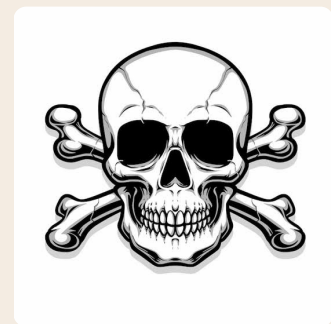
Sustancia que produce daño