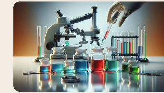
Ciencia que estudia intersecciones entre sustancias y sistemas biológicos.