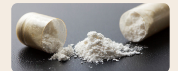
Sustancia química con principio activo.