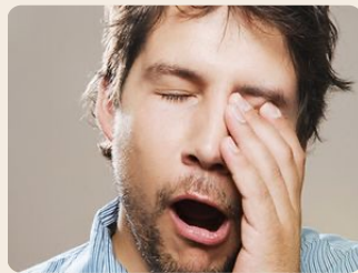
Efecto adicional no deseado pero leve