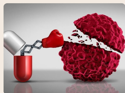
Sustancia inerte con efecto terapéutico