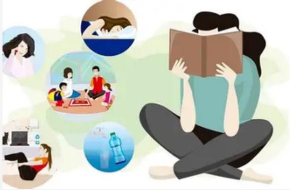
Dorothea Orem Teoría del autocuidado