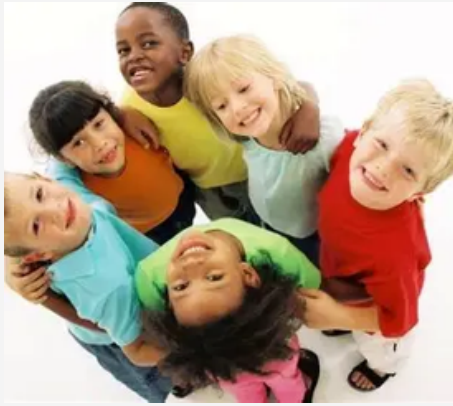
Callista Roy Modelo de adaptación