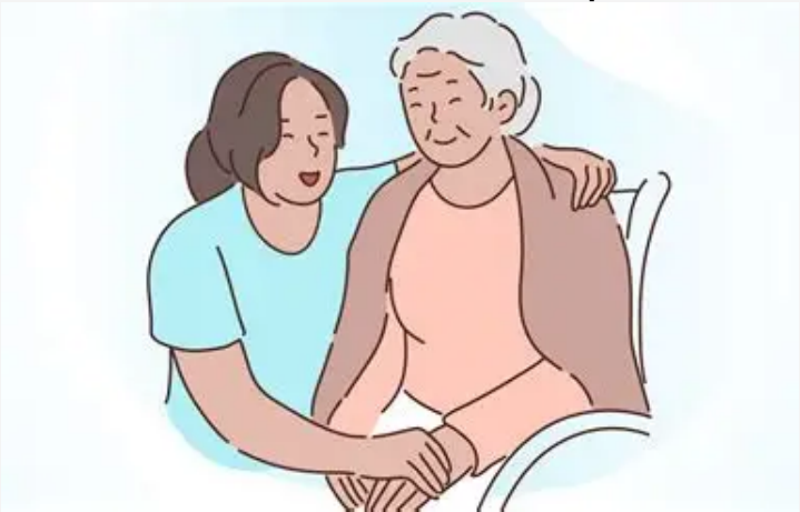
Jean Watson Teoría del cuidado transpersonal

Considera a la persona como un ser en el mundo de curación