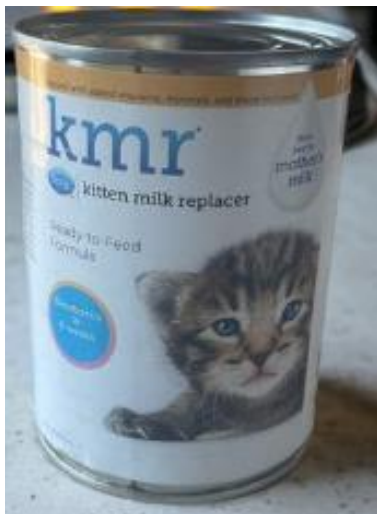
Fig. 2 primera leche dada al neonato