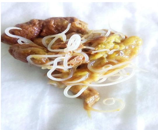
Fig.6 Las heces fecales del gatito A, (toxocara cati).