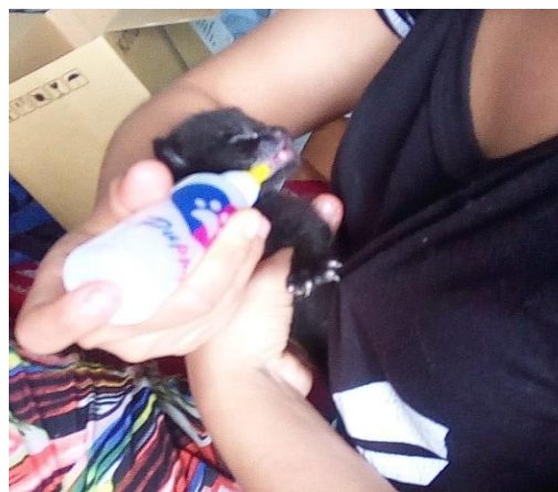
Fig.5 Manera incorrecta de alimentar un neonato felino.