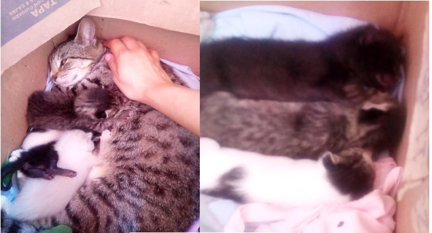
Fig. 1. Llegan los gatitos con su madre a la veterinaria