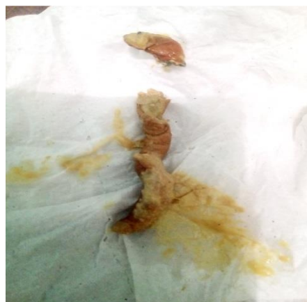
Fig.7 Las heces fecales del gatito B.