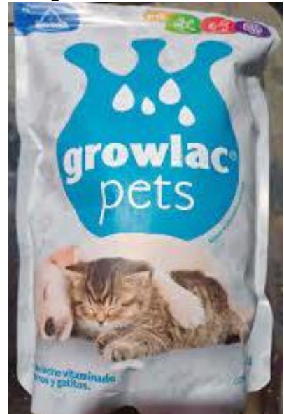
Fig.3 segunda leche dada al neonato