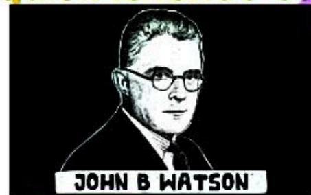
JOHN B. WATSON

teoría del aprendizaje, que dice que los comportamientos se adquieren a través de la interacción con el medio quien lo fundo es: