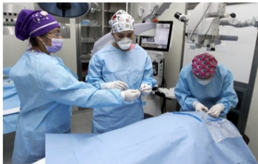
Personal médico prepara a un paciente antes de una cirugía en una sede del Instituto Mexicano del Seguro Social, en octubre de 2021.

Sheinbaum anuncia un plan de rehabilitación o apertura de hospitales en las tres redes públicas de más de 10.000 millones de pesos