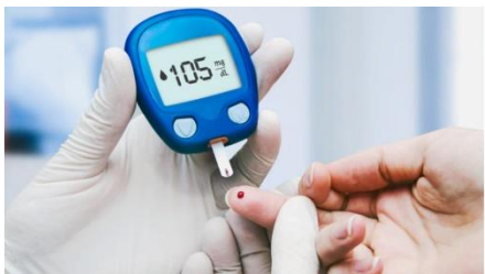
Figura 1. Demostración de toma de glucosa con Acu Chek Figura 1, Toma de muestra de glucosa.

Cuadro clínico: Los síntomas de la diabetes incluyen: aumento de la sed y de las ganas de orinar, aumento del hambre, sentirse cansado, visión borrosa, entumecimiento u hormigueo en los pies o las manos, llagas que no sanan, pérdida de peso sin razón aparente. Los síntomas de la diabetes tipo 2 a menudo aparecen lentamente, en el transcurso de varios años, y pueden ser tan leves que ni siquiera se notan. Muchas personas no tienen síntomas. Algunas personas no saben que tienen la enfermedad hasta que tienen problemas de salud relacionados con la diabetes, como visión borrosa o enfermedades del corazón.