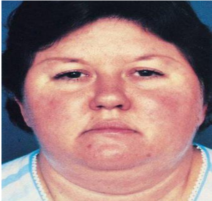
Figura 1. Paciente con cuadro clínico de Síndrome de Cushing

El Síndrome de Cushing consiste en un conjunto de signos y síntomas producidos por concentraciones elevadas de Glucocorticoides en la circulación. El exceso de los mismos puede originarse en las glándulas suprarrenales o por la administración de glucocorticoides a dosis supra fisiológicas por tiempo prolongado.