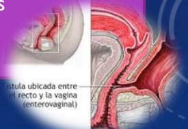
fístula ubicada entre el recto y la vagina (enterovaginal)