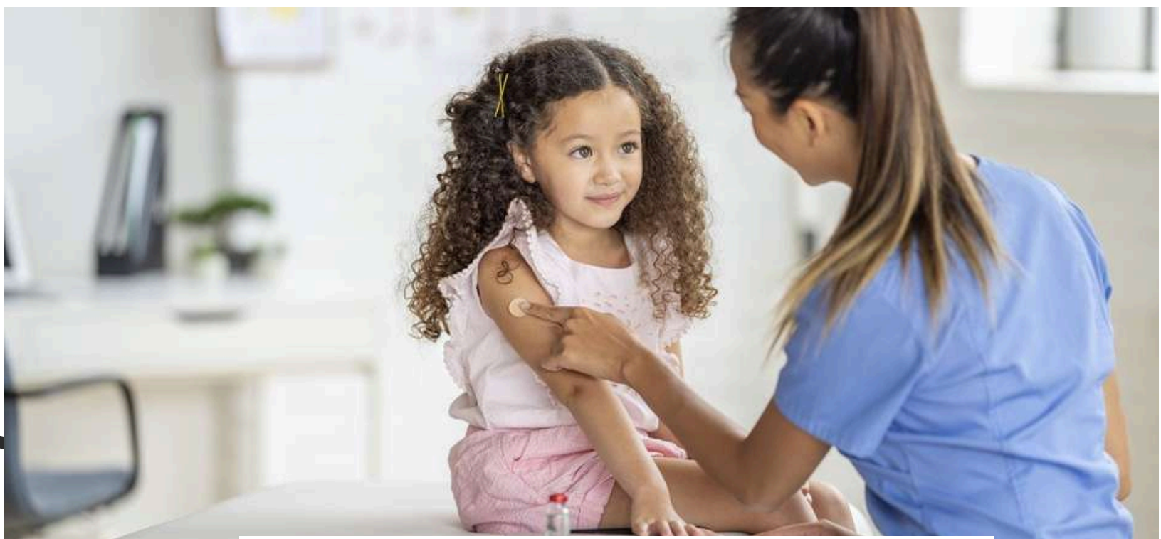
EVOLUCION HISTORICA DE LOS CUIDADOS. MODELOS Y TEORIAS

El Consejo Internacional de Enfermería, como la más antigua organización profesional internacional, ha clasificado las funciones fundamentales de la enfermería en cuatro áreas: promover la salud, prevenir la enfermedad, restaurar la salud y aliviar el sufrimiento.