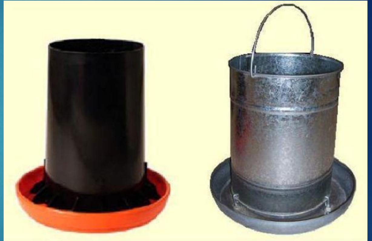
Un comedero de 20 kilos por cada 25 aves