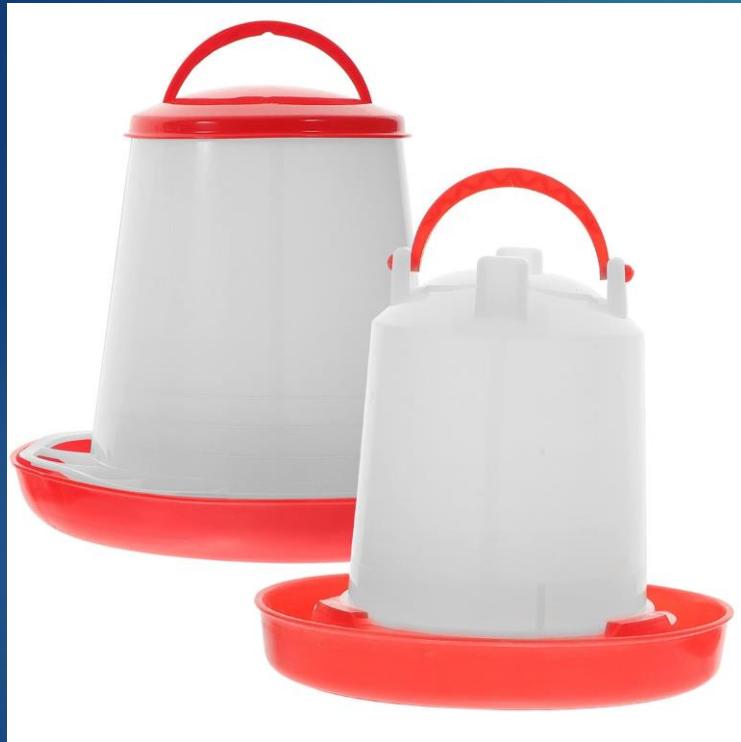
Un bebedero por cada 15 Aves