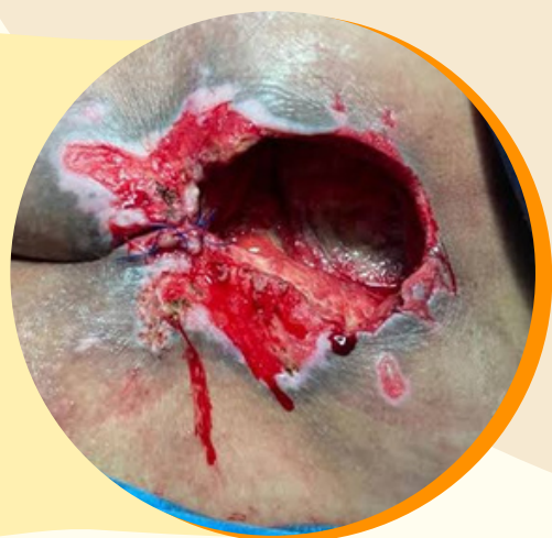
ESTADIOS DE ÚLCERAS

Las úlceras por presión son lesiones en la piel que se producen cuando se aplica presión excesiva y prolongada a una zona del cuerpo. Esto disminuye el flujo sanguíneo, lo que provoca que la piel se muera y se forme una úlcera