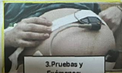
3. Pruebas y Exámenes: