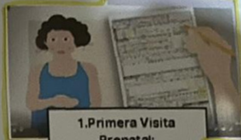
1. Primera Visita Prenatal: