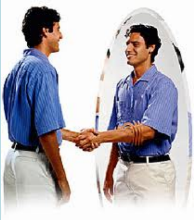
Imagen no verbal

la forma de vestir es un factor clave. Parfraseando un dicho muy popular, no basta con ser profesional sino que hay que parecerlo. Es decir, se debe ser coherente.