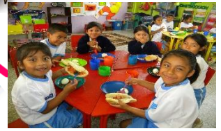
Educación y alimentación.