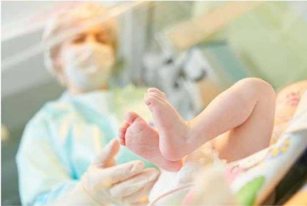
Catéter venoso central

Se trata de realizar la asepsia adecuada, colocar bien el catéter, evitar la aplicación de cremas o antibióticos en el lugar de la herida y verificar que no haya infecciones