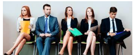
Imagen no verbal: es conveniente preocuparse por la postura corporal que se está adoptando. El cuerpo constantemente está hablando.

Fuente: Comunicación no verbal ¿Qué relación tiene con la Imagen Personal?