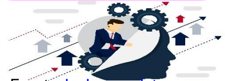
Imagen interna: Es todo lo relacionado con el ser interior.