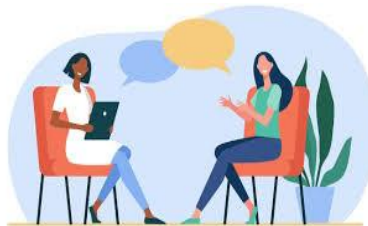
Imagen verbal: Saber enviar correctamente un mensaje sin errores de ortografía, tener una buena redacción, contestar adecuadamente el teléfono, etc.