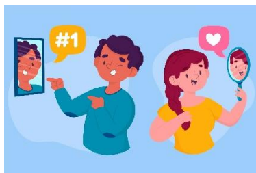
Imagen física o corporal.