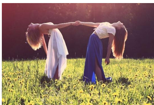
Imagen proyectada: Representa lo que eres hoy con tus imperfecciones y virtudes.

Imagen ideal: Es una proyección de lo que quieres ser y todavía no has alcanzado.