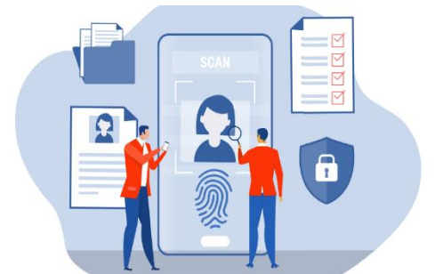
Imagen virtual que se crea de una persona en internet