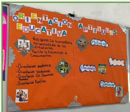
Cartel de exposicion