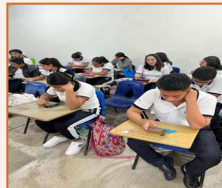
imagen 2: alumnos contestando el test