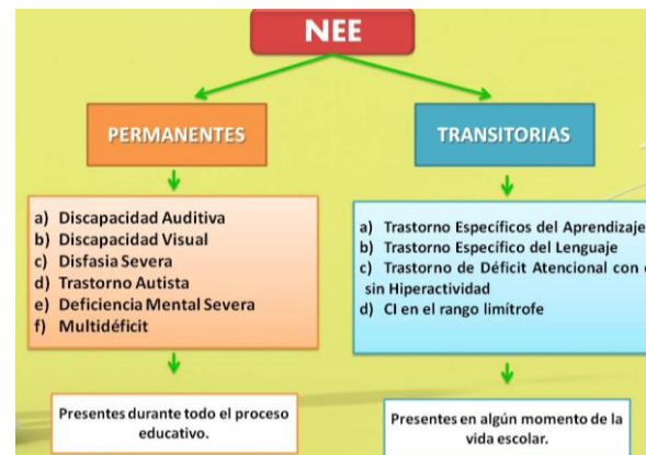
imagen 2: tipos de NEE