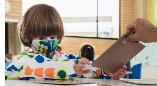
Imagen 5: aprendizaje interactivo obtenido de: El aprendizaje interactivo: sus características y ventajas