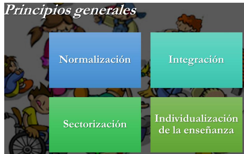
Imagen 3; principios generales

NEE: aquellos que sobreviven de alguna deficiencia de tipo físico, intelectual, que hace que incida de manera negativa sobre el aprendizaje A large grey arrow points from the definition box to the right.