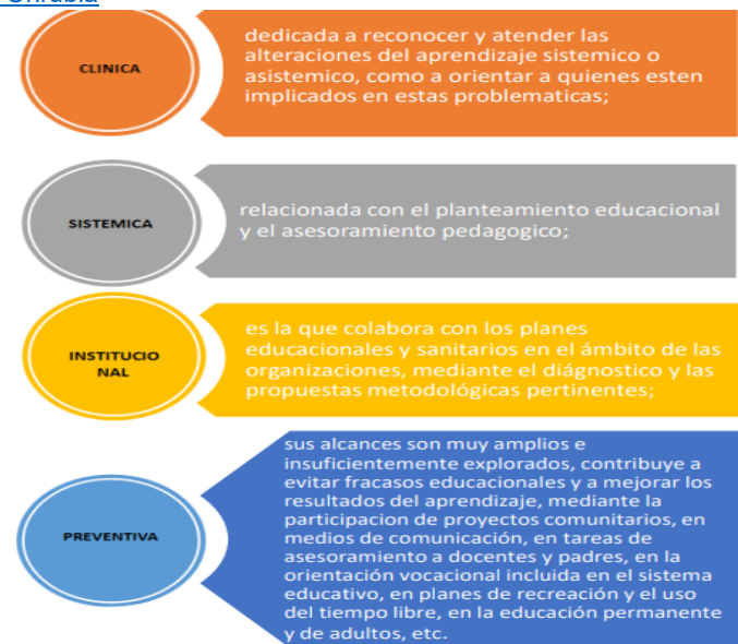
Imagen 7: campos de intervención