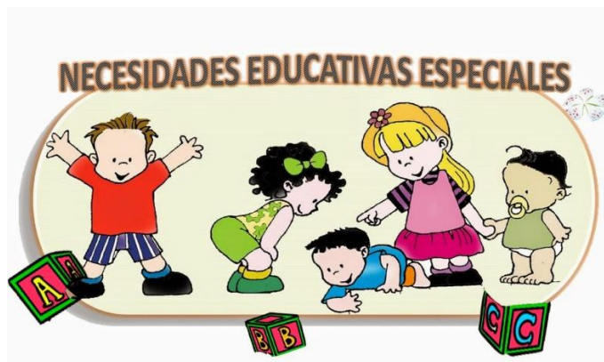
Imagen 1: concepto de NEE

Obtenido de: Necesidades educativas especiales (NEE). ¿qué son? – REDEM