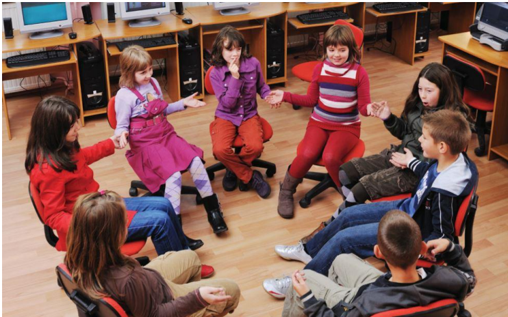
Imagen 4: interacciones en el aula Obtenido de:

Interacción educativa y aprendizaje escolar: la interacción entre alumnos por Rosa Colomina y Javier Onrubia