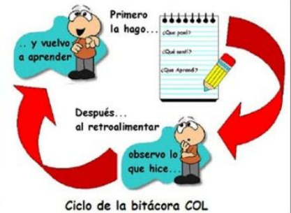
Ciclo de la bitácora COL