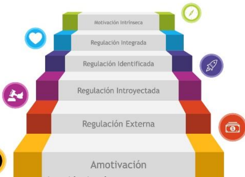
Imagen: motivación intrínseca