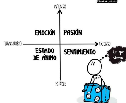
Imagen: emoción y estado de ánimo