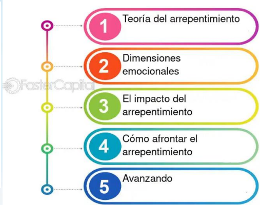
Imagen: teorías del arrepentimiento