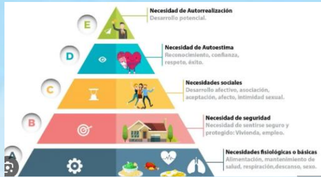
Imagen: proceso motivacional en psicología