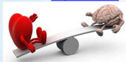
Imagen: Homeostasis emocional