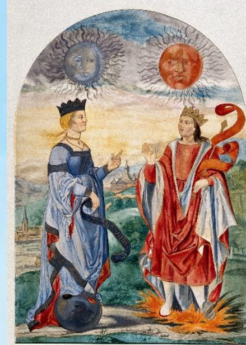
Imagen: Alquimia de la psicología