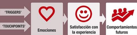
Imagen: Emociones

Relaciones causa-efecto entre emoción-comportamiento