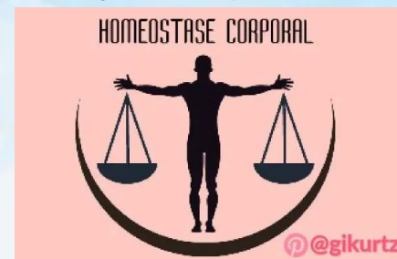
Imagen: homeostasis