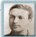
LEV SEMENOVICH VIGOTSKY

El lenguaje interno (significativo y semántico)