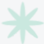
IMAGEN Y DESARROLLO DE SUS COMPONENTES..