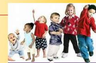
Desarrollo psicomotriz del niño