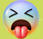
Sabor agrio o amargo