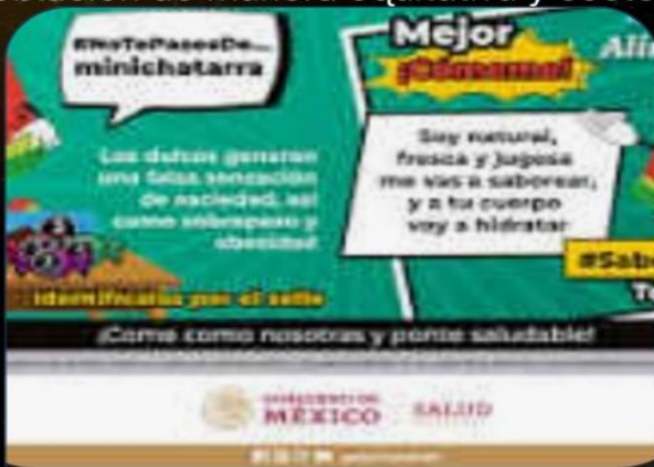
0. México instrumenta pol.

Las necesidades en la historia del capitalismo mundial se convierten en objetivos a medida que la sociedad evoluciona y se diversifica. Estos objetivos son el motor que impulsa la actividad económica y la innovación, y se traducen en la producción y distribución de bienes y servicios para satisfacer dichas necesidades. En un contexto empresarial, los objetivos suelen estar relacionados con la maximización del beneficio, la eficiencia en la producción, la calidad de los productos y servicios, la satisfacción del cliente, la responsabilidad social y ambiental, entre otros. Estos objetivos son fundamentales para el éxito y la sostenibilidad de las empresas en un mercado competitivo y en constante cambio. A nivel gubernamental, los objetivos suelen estar orientados hacia el crecimiento económico, la creación de empleo, la reducción de la pobreza, el desarrollo sostenible, la equidad social, la estabilidad financiera, entre otros. Estos objetivos guían la formulación de políticas públicas y la toma de decisiones para promover el bienestar de la sociedad en su conjunto.