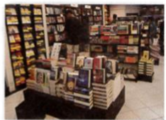
6. a bookstore