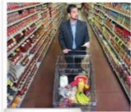
8. a supermarket