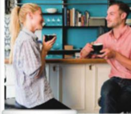
7. a coffee shop