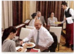
2. a restaurant