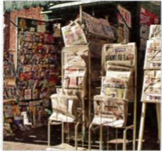
5. a newsstand