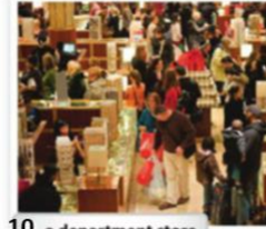
10. a department store