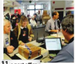
11. a post office

Exercise 1. Translate to Spanish the vocabulary above (Traduce al español el vocabulario de arriba).