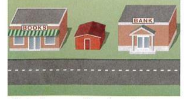
7. between the bookstore and the bank