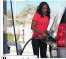
9. a gas station