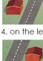
4. on the left