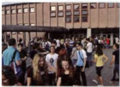
4. a school