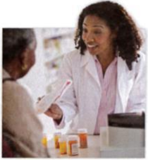
1. a pharmacy