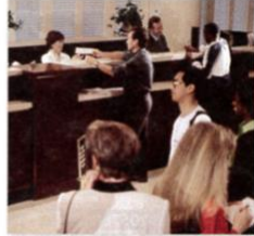
3. a bank