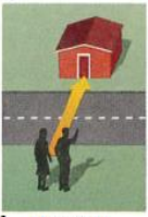
1. across the street