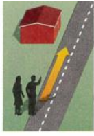
2. down the street