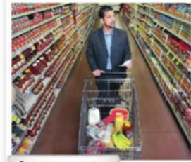
8. a supermarket