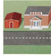
6. next to the bank