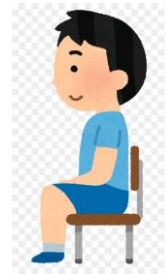
IMAGEN IDEAL VS. IMAGEN PROYECTADA

El lenguaje corporal humano se inicia con la formación del feto dentro del seno materno. Ya en la infancia, antes de hablar, los niños desarrollan un lenguaje corporal.