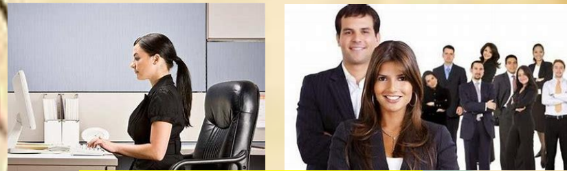
Imagen ideal vs. Imagen proyectada.

Podemos definir la imagen personal y profesional como todo aquel proceso de cambio físico-psicológico, que aplicamos en nosotros de manera individual con el objetivo de mostrar a los demás lo que somos en fondo y forma, misma que nos ayudará a generar opiniones favorables cada día más exigente era de la globalización