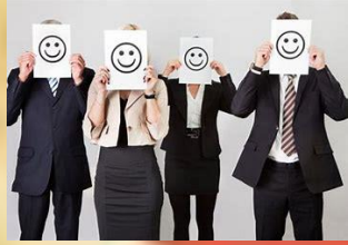
Imagen y desarrollo de sus componentes