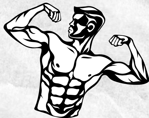
Imagen ideal vs. Imagen proyectada.

La Imagen Ideal: Es una proyección de lo que quieres ser y todavía no has alcanzado. Está vinculada a la montaña de deseos y sueños que hay en tu corazón y también a "lo que debes ser".