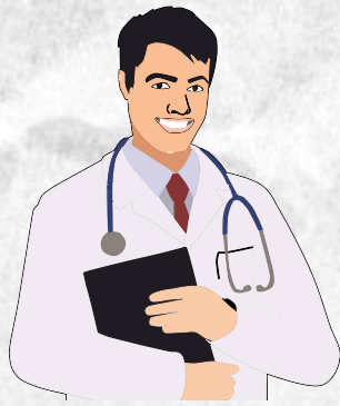
IMAGEN Y DESARROLLO DE SUS COMPONENTES.