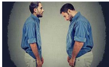
Imagen ideal vs. Imagen proyectada

El lenguaje corporal está relacionado directamente con la tradición, la geografía, la cultura, la herencia de los pueblos, el género, particularidades de nacimiento, la evolución, la religión y las características anatómicas.