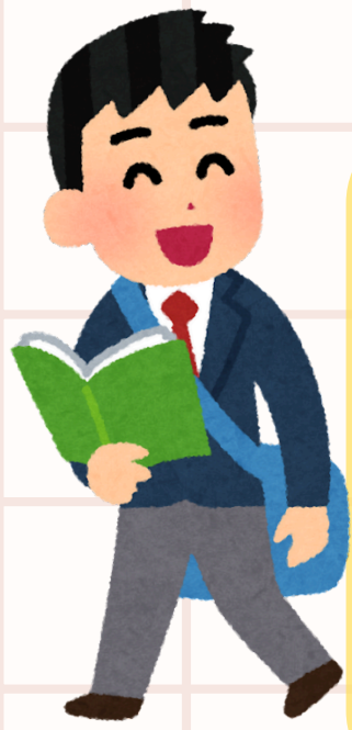
IMAGEN Y DESARROLLO DE SUS COMPONENTES