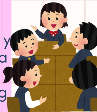
imagen ideal vs imagen proyectada

La imagen personal habla por nosotros y en el ámbito profesional representa una herramienta que puede actuar a tu favor o en tu contra. Cuidar tu branding personal puede ser un valor agregado que contribuirá al logro de tus objetivos