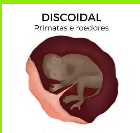
DISCOIDAL Primates e roedores