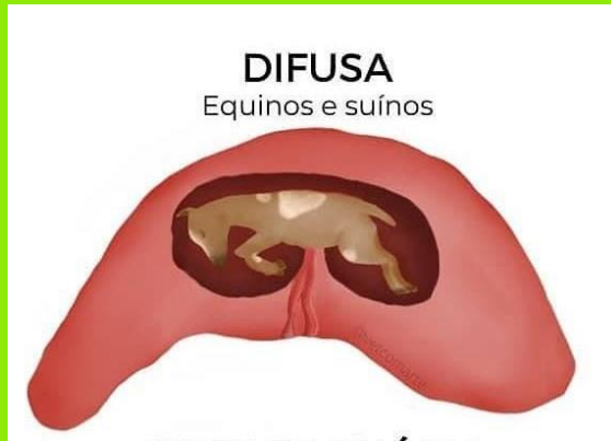
DIFUSA Equinos e suínos