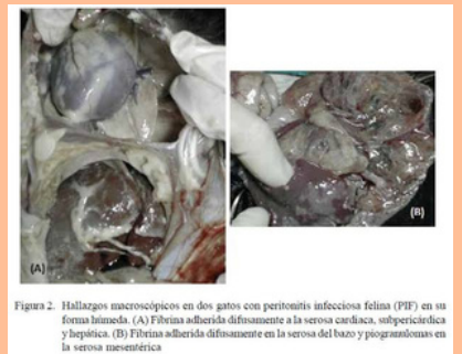
Figura 2. Hallazgos macroscópicos en dos gatos con peritonitis infecciosa felina (PIF) en sus formas húmeda (A) Fibrina adherida difusamente a la serosa cardíaca, subpericárdica y hepática. (B) Fibrina adherida difusamente en la serosa del bazo y páncreas en la serosa mesentérica

Tx: Prednisona, Antibiótico de amplio espectro, terapia de soporte