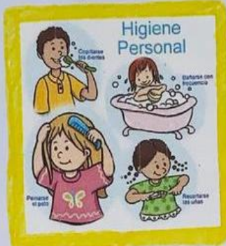
• Excelente Higiene