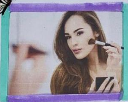
• Maquillaje para mejorar Presentación pero discreto.