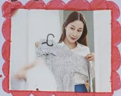
• Ropa adecuada