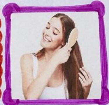
• Actitud Positiva