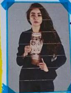
• Actitud no agradable.