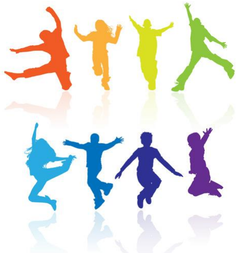
Imagen física o corpora