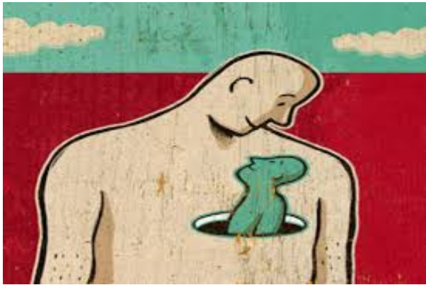
Imagen física o corporal (apariciencia) Imagen interna Imagen verbal Imagen no verbal