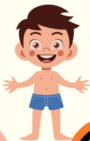
IMAGEN FÍSICA O CORPORAL