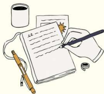
IMAGEN NO VERBAL

Saber enviar correctamente un mensaje sin errores de ortografía