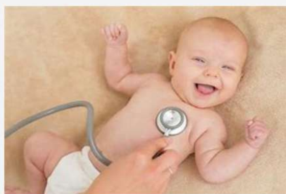
bebe con apariencia y pulso normal

la frecuencia cardíaca o mas conocida como pulso es algo que la escala de Apgar valora ya que puede venir con una puntuación de 0 que es sin pulso, o una puntuación de 2 que es con f/c de mas de 100 latidos por minuto