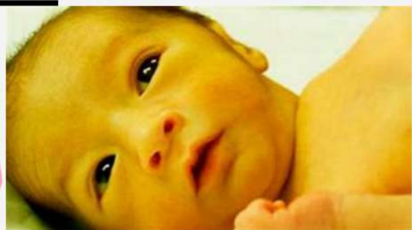
bebe con ictericia (APARIENCIA)

la escala de Apgar evalúa lo que es la Apariencia, Pulso, Gestos, Actividad y Gestos. esto se tiene que hacer en los primeros 5 minutos de nacido, y a ella se le asigna una puntuación la que define la salud del R/N