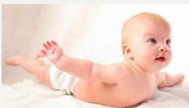
este bby esta al 100 en su tono muscular

en la actividad se refiere al tono muscular, si viene flacidito o rigido esto podria ayudar a ver si en bebe es un prematuro o a termino