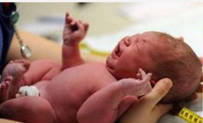
color normal (rosita)