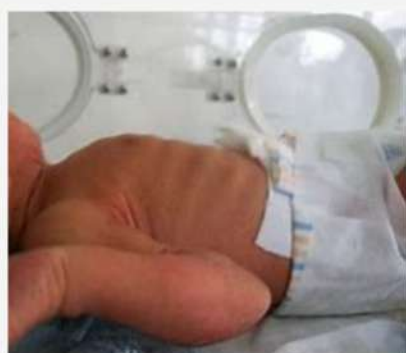
este es un bebe prematuro por la piel con la caja torácica extendida