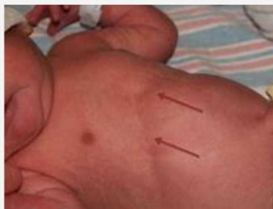
bebe con tiraje intercostal

es aquella retracción de músculos entre las costillas