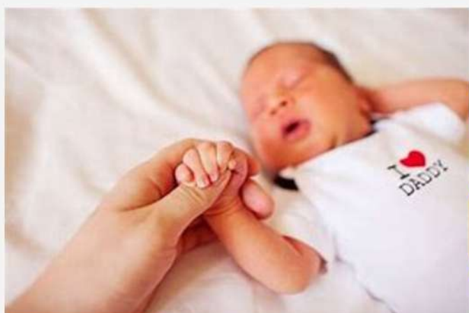
gesto de agarrar la mano