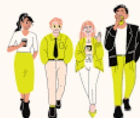
Investigación de campo

La investigación de campo es aquella que se centra en fenómenos que surgen en determinada zona y es necesario transportarse hasta ella para poder investigar.