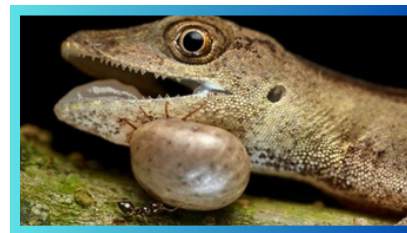
El bienestar animal en animales domésticos