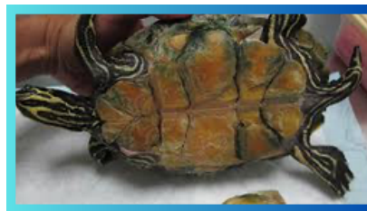
La retención de muda en las tortugas

https://clavicveterinariagalán.es/gatos-y-estres-sintomas-y-tratamiento/