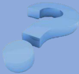
Formularla como una pregunta

Para que una idea de investigación sea clara se recomienda