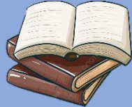
Lecturas de libros, revistas, Tesis, periódicos