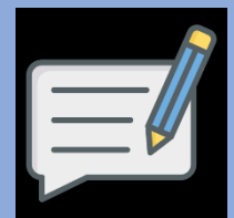
Meditar y escribir sobre las implicaciones de estudiar la idea