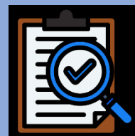
Examinar temas cotados