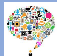
Relacionar nuestras ideas personales con la investigación