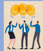
Compartir las ideas