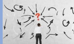
Formular el problema

Implica organizar y desarrollar de manera lógica y clara los componentes básicos que forman la base del estudio científico. Esto permite definir con precisión el tema a investigar, los objetivos y la metodología a emplear, además de justificar su importancia