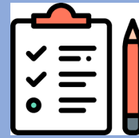
Organizar el trabajo