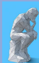
Reflexionar sobre la idea